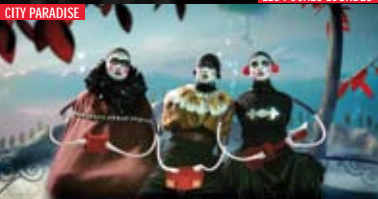
LES POCHEs LOURDES