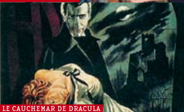
LE CAUCHEMAR DE DRACULA