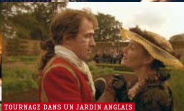
TOURNAGE DANS UN JARDIN ANGLAIS