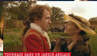
TOURNAGE DANS UN JARDIN ANGLAIS