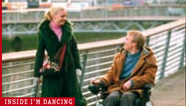
INSIDE I'M DANCING