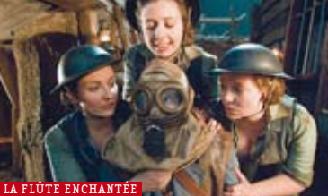
LA FLÛTE ENCHANTÉE