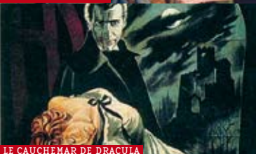
LE CAUCHEMAR DE DRACULA