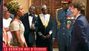
LE DERNIER ROI D'ÉCOSSE